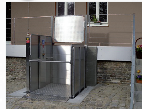
Hetek Hebelift Scherenhebebühne