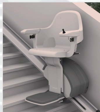
Homeglide Treppenlift für Außen