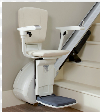
Homeglide extra für gerade Treppen