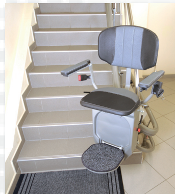
Eurolift Treppenlift Zweirohrsystem