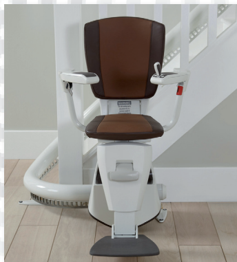
Flow 2 Treppenlift Einrohrsystem