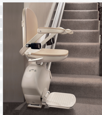
Acorn 130 für gerade Treppen