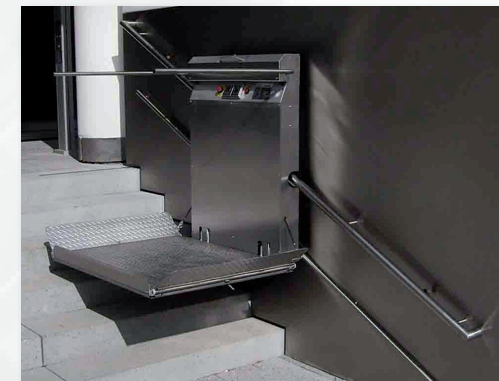
GTL 20 Plattformlift gerade