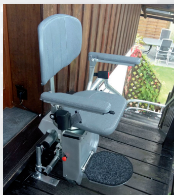
Eurolift Kurvenlift für Außen