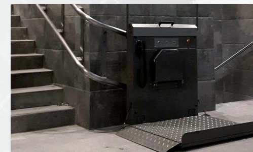
GTL 30 Plattformlift kurvig